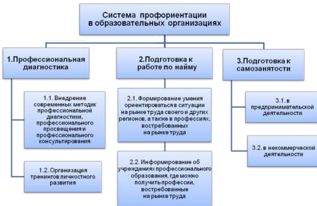
Рис. 2. Новая система профориентации в общеобразовательных организациях

Представляется, что новая система профориентации в общеобразовательных организациях должна включать в себя следующие обязательные блоки (Рис. 2):